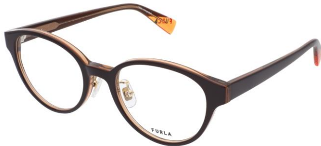
07L7 フロント テンプル

Shiny Black / Gray / Clear Gray Shiny Black / Gray / Clear Gray