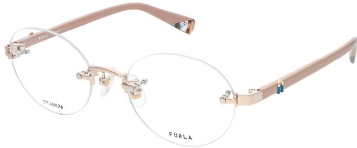
07ES フロント テンプル