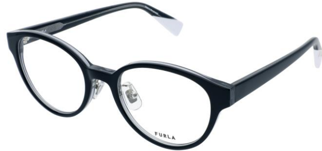
01EP フロント テンプル

Shiny Clear Gray / Clear Blue Gray / Clear Shiny Clear Gray / Clear Blue Gray / Clear