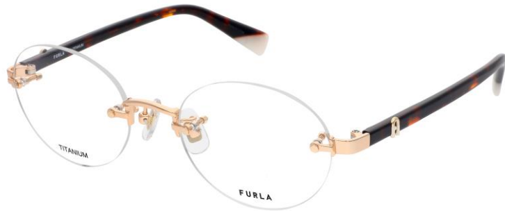
02AM フロント テンプル