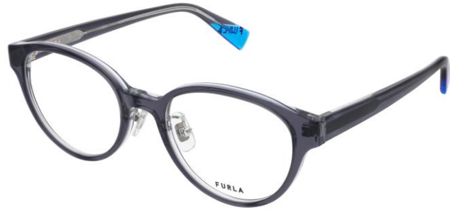
01AP フロント テンプル

Shiny Clear Gray / Clear Blue Gray / Clear Shiny Clear Gray / Clear Blue Gray / Clear