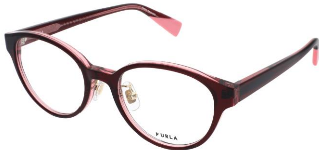
07QR フロント テンプル

Shiny Brown / Light Brown / Clear Light Brown Shiny Brown / Light Brown / Clear Light Brown