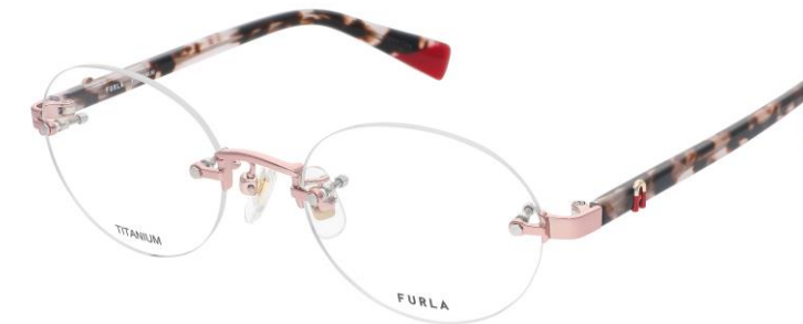
08R5 フロント テンプル